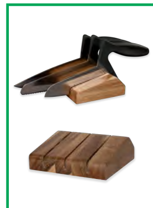
Tabla para cortar alimentos Webequ